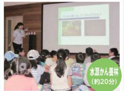
水源かん養林 (約20分)