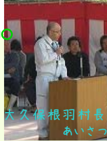
大久保根羽村長 あいさつ

明治用水は、矢作川上流の根羽村で森林の維持管理を100年以上前から行っています。