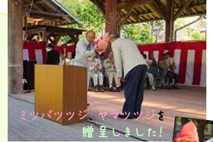
ミツバツツジ ヤマトツツジを 贈呈しました!