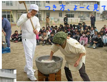
つき方、よく見ていてね!