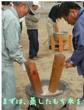
まずは、蒸したもち米をつぶします