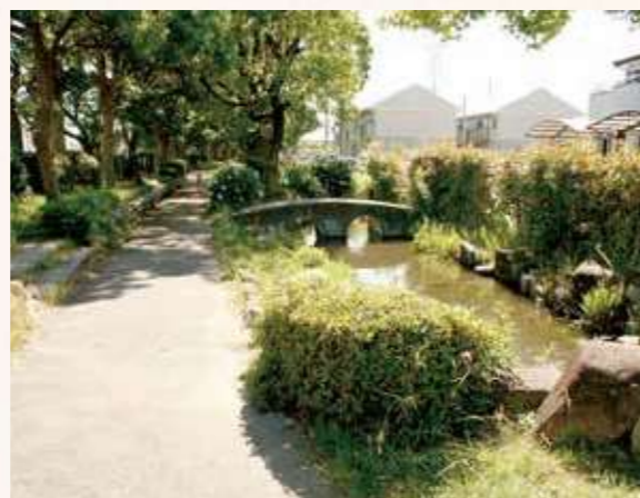
中井筋せせらぎ水路