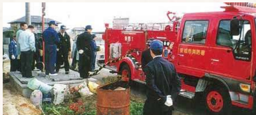
消防水利施設 (安城市箕輪町他)