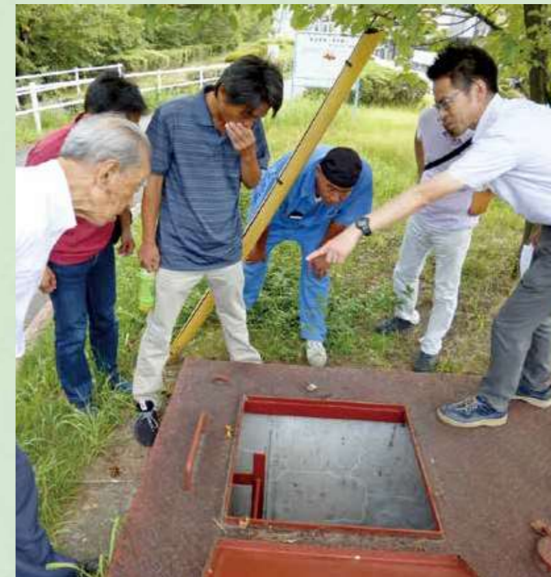
研修で地下のパイプラインを確認