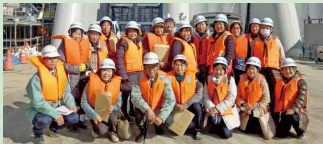
明治用水頭首工耐震化対策工事現場視察