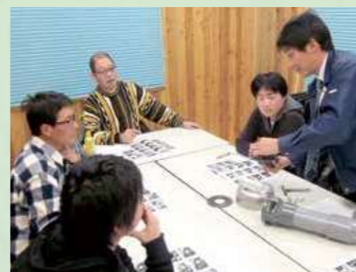
水のかんきょう学習館にて給水栓の説明

青壮年部は、農業を担う青壮年の立場で当土地改良区の事業及び施設管理に対する理解を深めることを目的に、平成19年5月に発足。現在、会員は19名で土地改良施設や工事現場の視察、会員相互の意見交換会等を行っている。