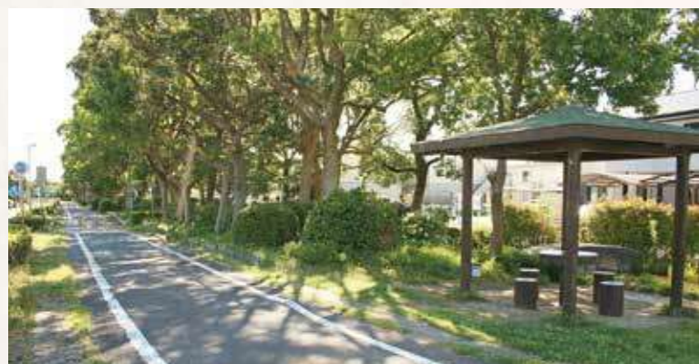
市道中井筋自転車道 (3.6km / 安城市池浦町)