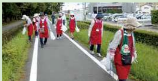
東井筋の上部清掃

女性部は、女性の立場から意見を述べ改良区の管理運営に活かすため、平成12年8月に組合員またはその家族の女性30名で発足した。活動内容は、水源かん養林・管内工事現場・管外土地改良施設の視察、水路上部の清掃、啓発活動等多岐にわたっている。