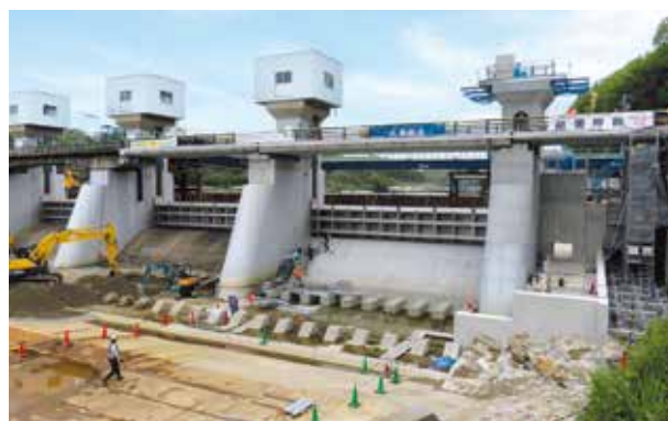
P1堰柱（左：上流・右：下流）【令和8年4月現在】