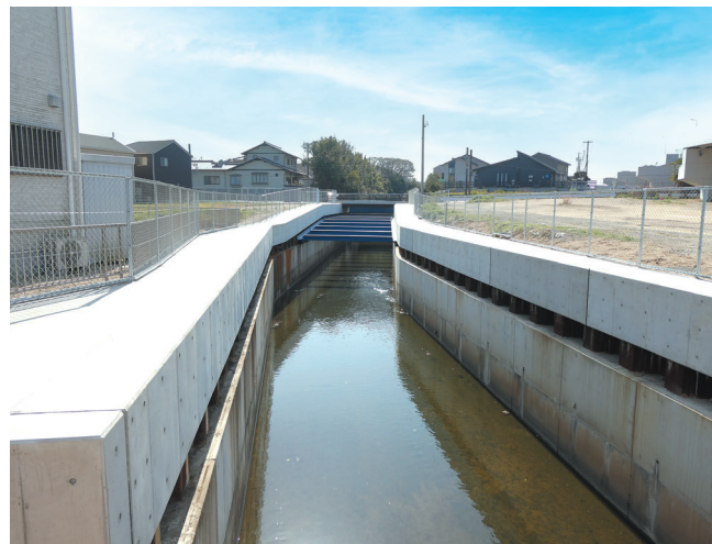
▲高浜市呉竹町（中井筋用悪水）

明治用水は、明治13年に開削された水路ですが、明治用水土地改良区としての組織（戦後の土地改良区）は昨年で設立70年を迎えました。これまで多くの方々に関わり、農業生産性の向上や水利用の効率化などに取り組み、地域の発展に大きな貢献をしてきました。さらに、近年では、都市化が進むにつれて建物や舗装面積が増加し、雨水の浸透や蓄積が困難になり、洪水や水害のリスクが高まっています。そこで、都市化に伴う雨水対策として排水路の改修を行っています。なかでも安城市西部と刈谷市南部、そして高浜市の一部を流域とする中井筋用悪水路は平成12年から通水断面を大きくして排水能力を高める工事を行い、完了は今年度を予定しています。20年を越える期間でありましたが水路施設は生息する魚類などに配慮され、環境にやさしい施設になりました。これら施設は地域の大きな財産となっていますが、その歴史とともに、明治用水土地改良区が持つ役割や価値を再認識し、今後も一層の発展に向けて取り組んでいくことが、地域の発展にもつながると信じています。