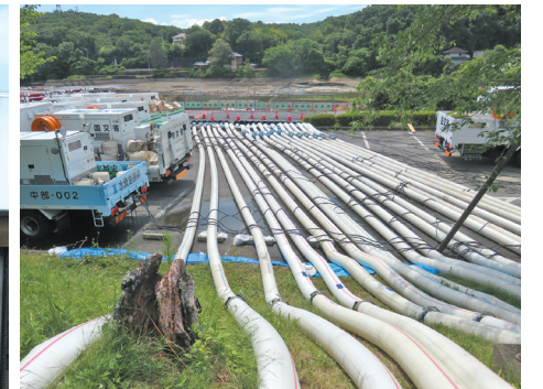
▲集結したポンプ車と設置された給水ホースの一部