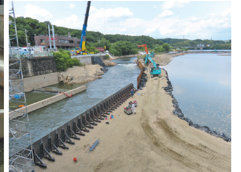
▲矢作川右岸に鋼矢板や土のうで仮設水路を設置している様子