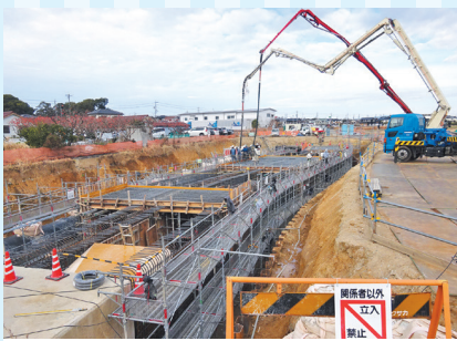
明治本流耐震化工事状況