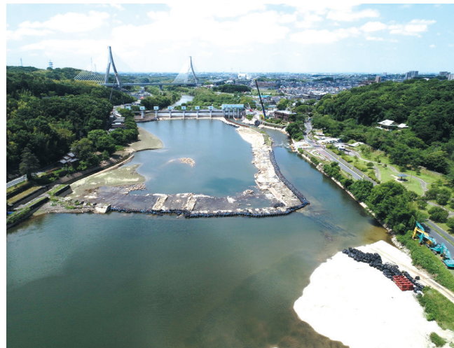
▲取水不能の明治用水頭首工 (R4.6.12撮影)

識されることとなりました。また、明治用水頭首工から明治本流、中井筋を下り安城市篠目町にある「工業分水工」までの約15kmは農業用水と工業用水が共用され、ここで工業用水は分水し、愛知県西三河工業用水道の専用管に引き継がれて安城市福釜町にある「安城浄水場」に送られ、衣浦臨海工業地帯及び西三河地域の132の企業に合計一日に約28万m 3 が送水されています。地域の農業と工業にとって重要な施設であり、この様な事故が発生しないよう土地改良施設の維持管理はもとより、関係機関と連携して健全な運営を図ることが重要であると考えております。