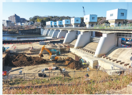
明治用水頭首工復旧工事状況

明治用水頭首工については、昨年5月の漏水事故発生直後から復旧対策工事が行われていますが、今年度からは本復旧工事を進めてまいります。 また、明治幹線についても耐震化対策工事を引き続き実施してまいりますので、今後ともご理解ご協力をお願いします。