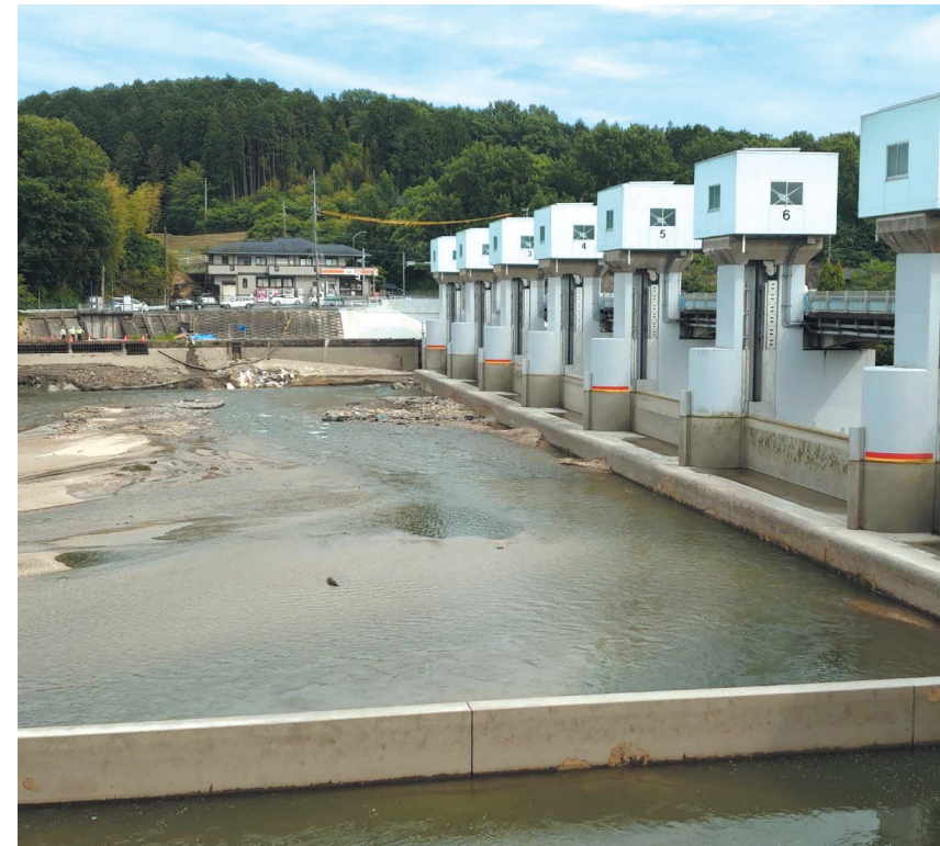
▲令和4年5月19日 事故発生4日目の頭首工の様子

●令和5年6月1日発行 ●発行所/明治用水土地改良区 〒446-0065 愛知県安城市大東町22-16 TEL0566-76-6241 FAX0566-75-7944 ●責任者/杉浦正行 ●ホームページ: http://www.midorinet-meiji.jp/ ●E-mail: meijiyousui@midorinet-meiji.jp