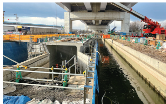
▲豊田市内郷町地内 高架は伊勢湾岸自動車道

結びに、皆様方にご協力いただいております管理障害補償金は、本土地改良区の事業、活動の費用に充てております。引き続き、地域に憩いの場を提供し皆様の暮らしに役立つよう努めてまいりますので、ご理解とご協力をいただきますようよろしくお願いいたします。