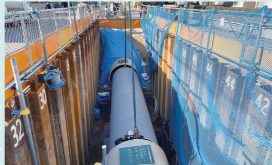
既設FRPM管φ1500に鋼管φ1350を挿入し耐震化