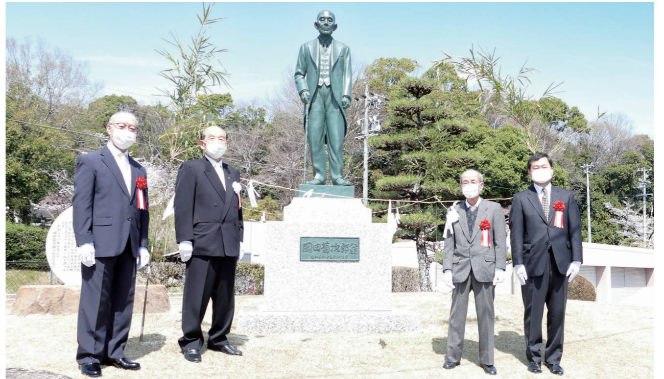
▲銅像移設完工式にて（除幕の儀）

●令和4年6月1日発行 ●発行所/明治用水土地改良区 〒446-0065 愛知県安城市大東町22-16 TEL0566-76-6241 FAX0566-75-7944 ●責任者/杉浦正行 ●ホームページ: http://www.midorinet-meiji.jp/ ●E-mail: meijiyousui@midorinet-meiji.jp