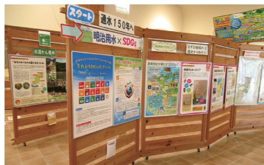
▲明治用水水のかんきょう学習館 『通水150年へ 明治用水×SDGs』展