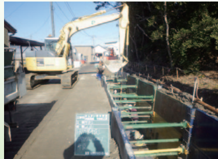
◀ 住宅近接部の 施工状況 (安城市小川町)