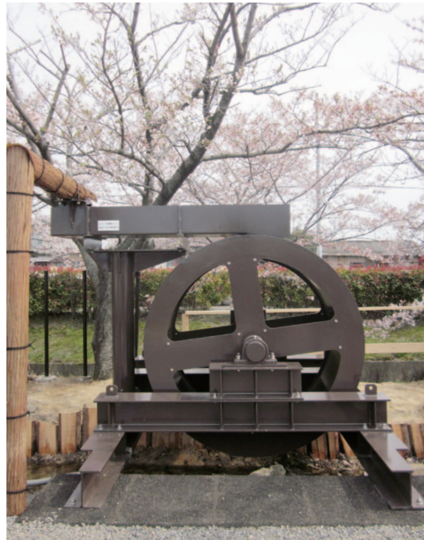
▲ 童子さらさら川に設置された水車型発電所

●発行平成26年6月1日 明治用水土地改良区 〒446-0065 愛知県安城市大東町22-16 TEL0566-76-6241 FAX0566-75-7944 (平成26年11月頃まで右記仮事務所 〒446-0056 愛知県安城市三河安城町1-10-14 MAパークビル1階) ●責任者/神谷金衛 ホームページ: http://www.midorinet-meiji.jp/ E-mail: meijiyousui@midorinet-meiji.jp