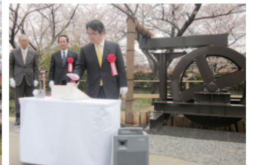
▲ 通電スイッチを押す大村愛知県知事