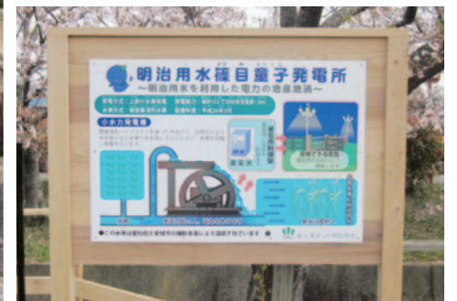
▲ 篠目童子発電所説明看板