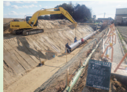
◀ 用水管φ900mm 布設状況 (安城市小川町)

村高用水は県営事業により平成18年度から工事を始め、概ね全線管水路となり、これまで揚水機でかんがいていた地区が、自然圧でのかんがいができるようになります。これによって、揚水機の電気代、地元役員さんによる運転操作等が不要となり、大幅な維持管理費の軽減ができてことになります。また平成26年度以降は、揚水機場の撤去等の工事を予定しており、村高用水の水路上部を多目的に活用することが計画されています。