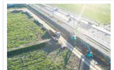
北柳原地区 北柳原用水付替その1工事