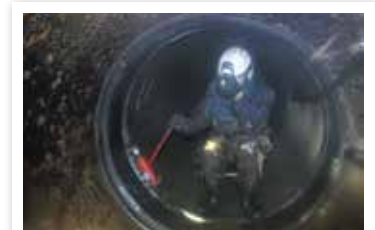
柳原地区 柳原用水止水バンド設置工事