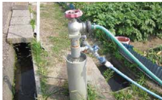
畑地用給水栓（写真②）