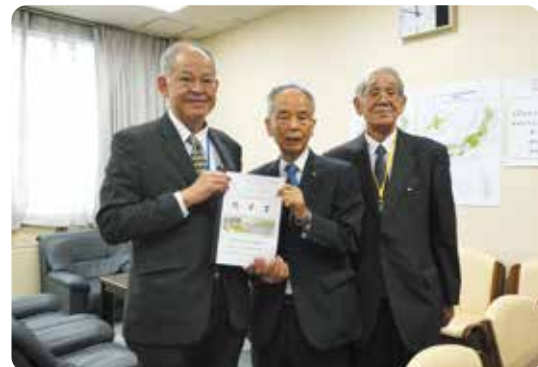
農林水産省 石川整備部長と手交