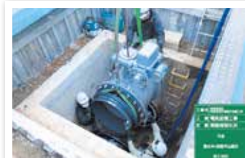
東高根地区 電動弁設置工事