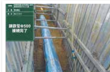
永井田地区 永井田用水改良工事