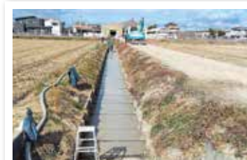
東牧内地区 東牧内支川改良工事