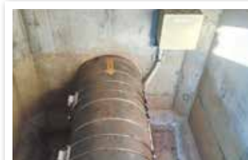
東井筋地区 流量計取替工事