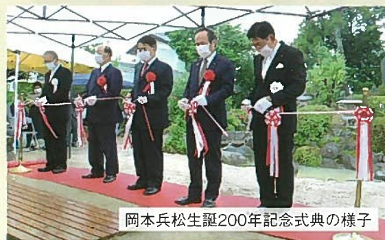
岡本兵松生誕200年記念式典の様子

この節目となる年に、先人の偉業を称え、水の恵みと実りある豊かな大地に改めて感謝したいものです。