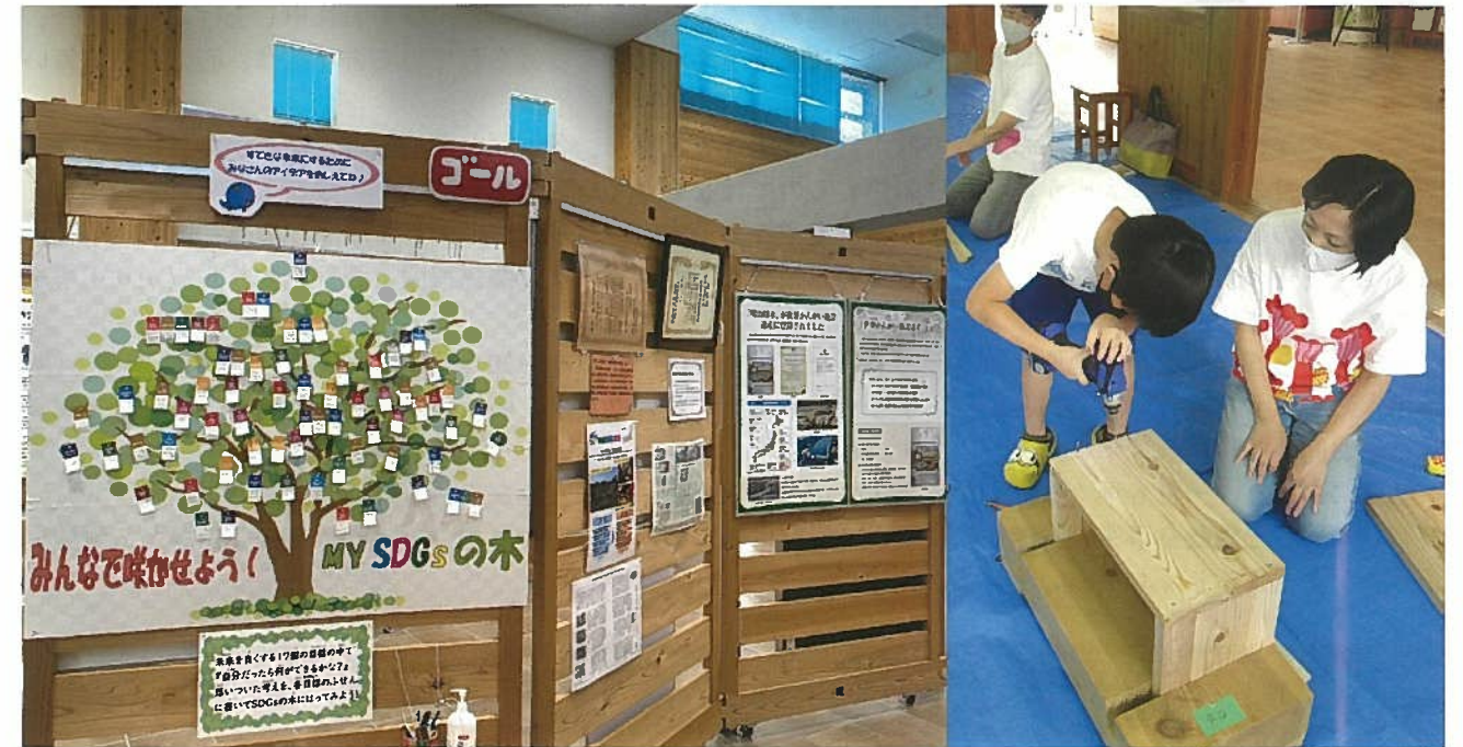
左はSDGs展のゴールにある MY SDGsの木 来館者へ自分たちでできることを考えるきっかけに。 右は8月に行われた体験プログラム「ネイチャークラフト」で根羽村の間伐材を使った本箱を作りました。

●令和3年12月1日発行 ●発行所/明治用水土地改良区 〒446-0065 愛知県安城市大東町22-16 ☎(0566)76-6241 ●責任者/杉浦正行 ●ホームページ : http://www.midorinet-meiji.jp/ ●E-mail : meijiyousui@midorinet-meiji.jp