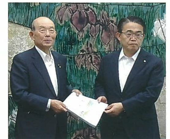
大 村 愛 知 県 知 事 に 要 請 書 を 手 交