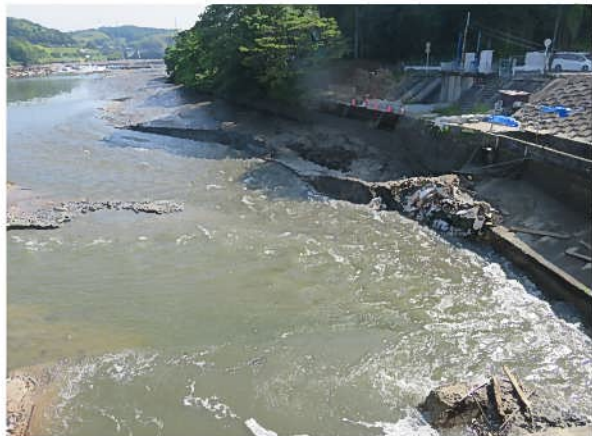
No.5 R4/5/17 明治用水頭首工漏水箇所状況 豊田市水源町地内