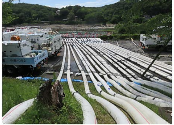
No.10 R4/6/1 頭首工上流部ポンプ設置状況② 豊田市水源町地内