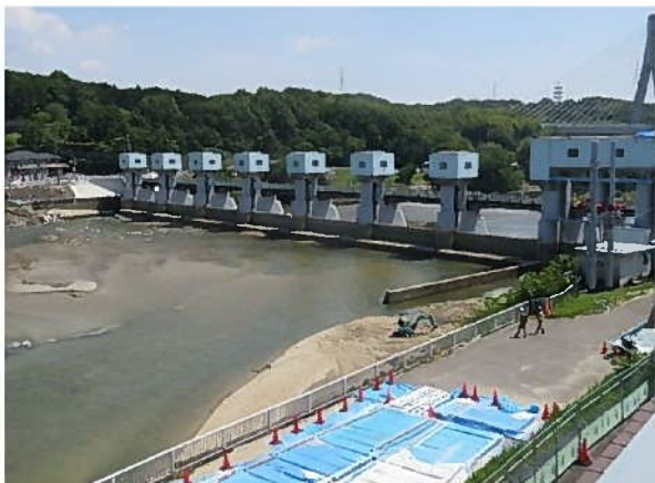
No.1 R4/5/17 頭首工上流低水位状況 豊田市室町地内 明治用水水源管理所より