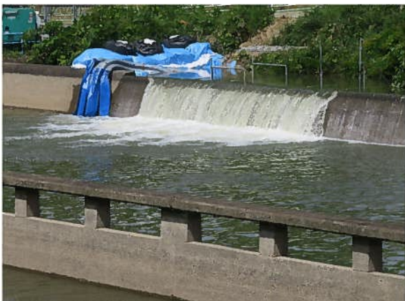
No.11 R4/6/1安永川から沈砂池への取水状況 豊田市水源町地内