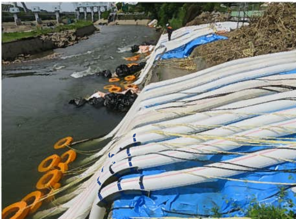
No.9 R4/6/1 頭首工上流部ポンプ設置状況① 豊田市水源町地内