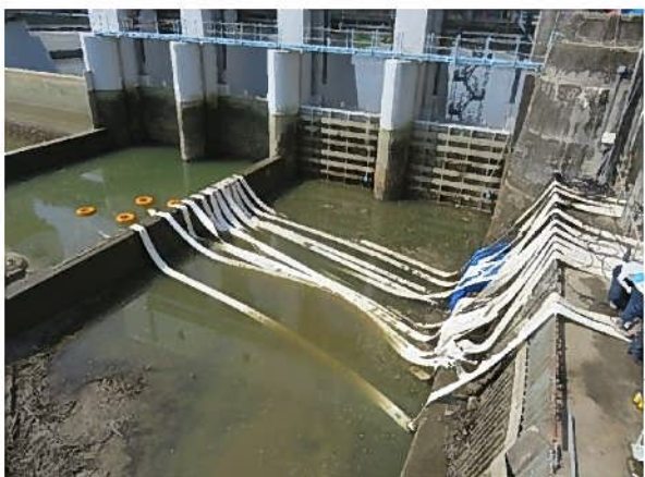
No.3 R4/5/18 頭首工取水口ポンプ設置状況 豊田市水源町地内