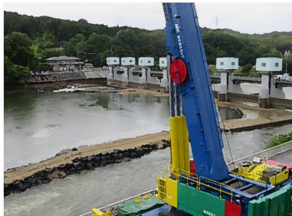
No.2 R4/6/6 頭首工上流部作業道築造状況 豊田市水源町地内 明治用水水源管理所より