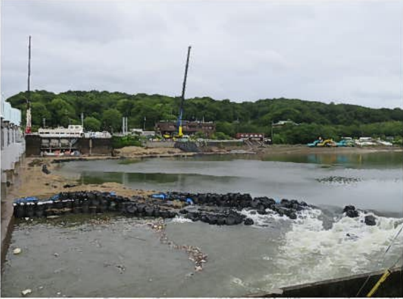
No.7 R4/6/6頭首工土嚢設置状況① 豊田市水源町地内