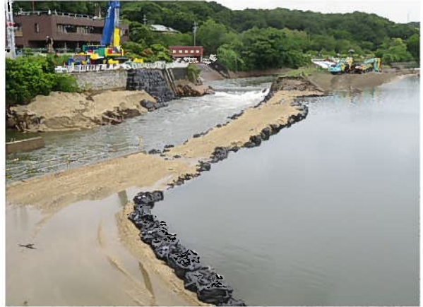
No.8 R4/6/6 頭首工土嚢設置状況②作業道路築造 豊田市水源町地内